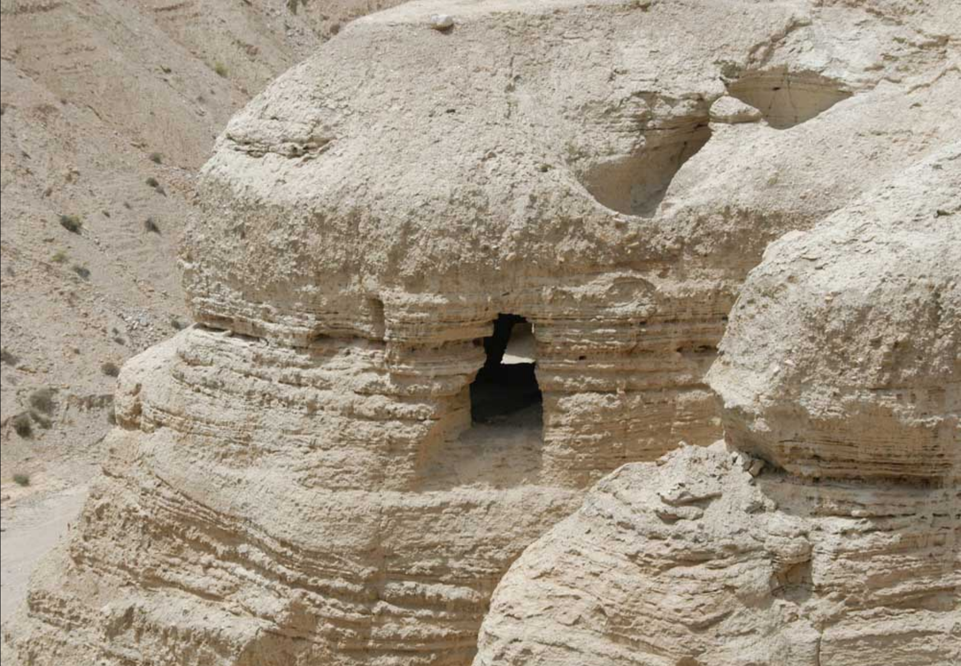
昆兰第四号洞穴：90%的死海古卷皆藏于此洞。